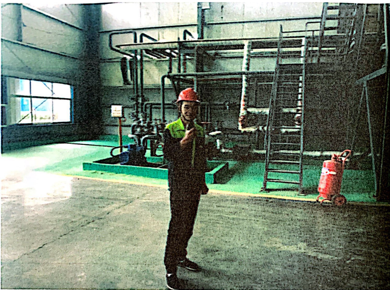
模拟火势较小，组织义务消防员进行扑救。