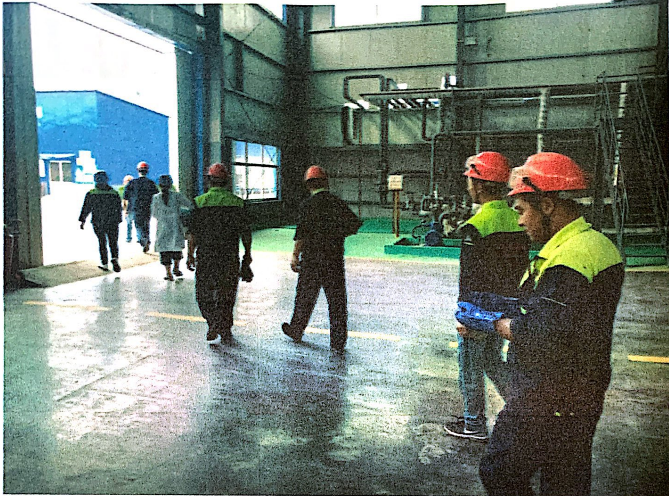
所有人到厂区内集合，由公司领导对本次演练进行点评总结